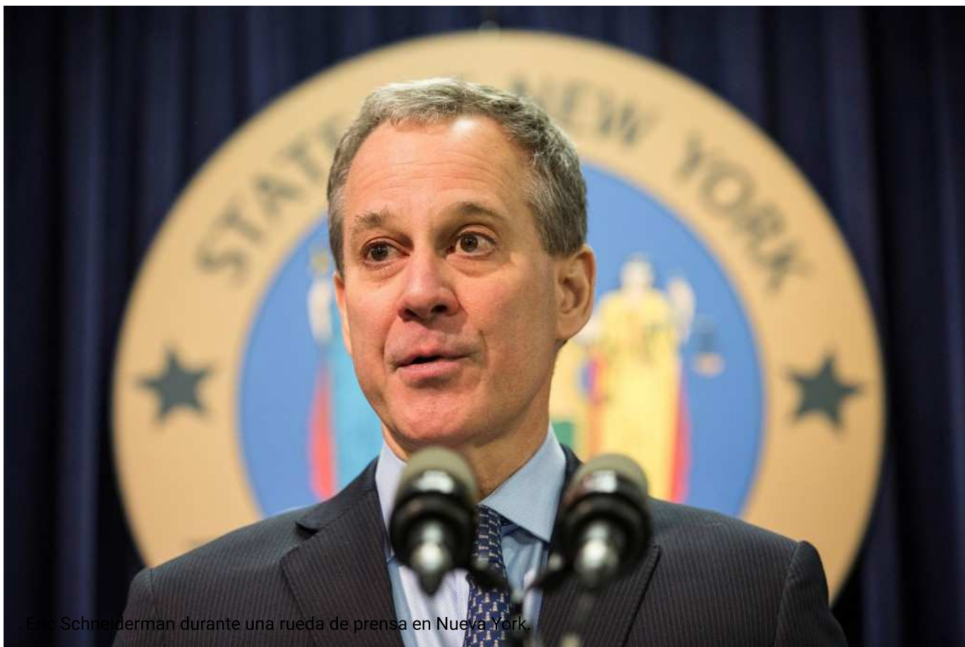
Eric Schneiderman durante una rueda de prensa en Nueva York.